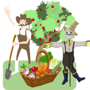
le maraîchage cueillette classification techniques