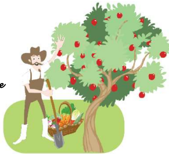
la découverte de la ferme