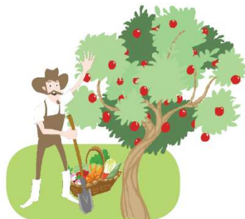
la découverte de la ferme