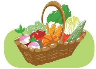
les fruits et légumes cueillette dégustation classification