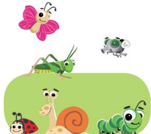
les petites bêtes du potager chasse classification amis/ennemis