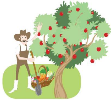
la découverte de la ferme