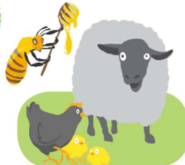
les animaux soin mode de vie élevage