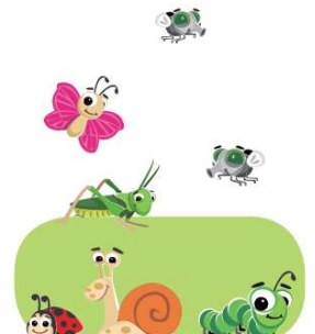
les petites bêtes du potager chasse classification amis/ennemis