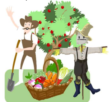
le maraîchage cueillette anatomie de la plante techniques