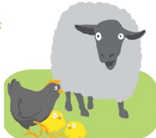
les animaux soin mode de vie élevage