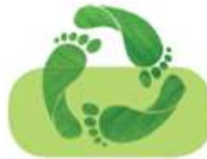
l'empreinte écologique de la Finca notions d'écologie agriculture Bio